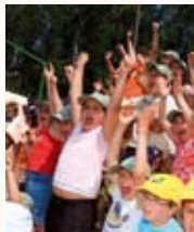
© S. PEDRO DE RATES ✓ PELOURO DA EDUCAÇÃO

Durante três dias, mais de 4 centenas de crianças vão participar no xv Acampamento Juvenil, cujo tema deste ano é “Direitos e Deveres das Crianças”. O fim-de-semana será recheado de actividades em torno do tema. Novas amizades e muito divertimento farão também parte deste convívio cujo ponto alto será o espectáculo de sábado, 20, quando todas as crianças participantes irão actuar perante o público.