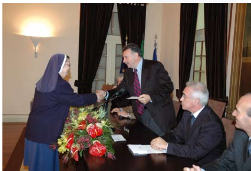
Presidente da Câmara entrega a verba correspondente ao Instituto Madre Matilde