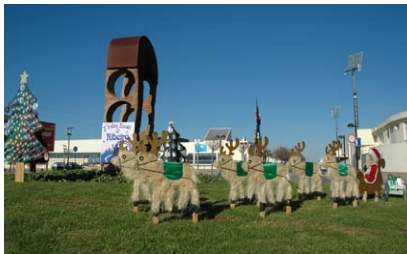
Rotunda do Alto de Martim Vaz, decorada pelo jardim de infância “O Ribeiro”

Participaram neste concurso, organizado pela Câmara Municipal: Mapadi, o Agrupamento Vertical Campo Aberto, o Colégio de Amorim, o jardim de infância O Ribeiro, o Centro Social Paroquial de Aver-o-Mar e o Agrupamento Vertical Cego do Maio.