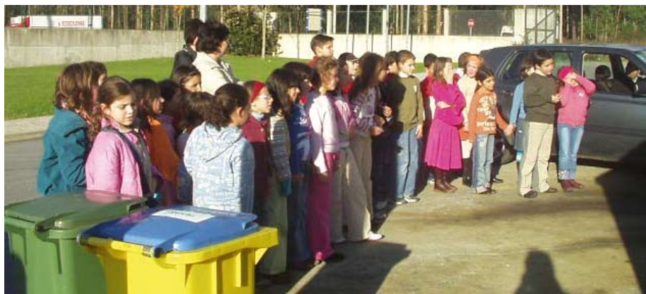
Crianças participaram na abertura da campanha Troca por Troca

oferecido pelo Núcleo Florestal do Tâmega. O início da campanha foi assinalado no dia 5, com a participação do Vereador do Pelouro do Ambiente e de um grupo de cerca de 20 crianças do grupo eco-escolas da Escola do Século, que participaram em várias actividades relacionadas com a reciclagem e com a transformação de materiais recicláveis nos mais variados objectos.