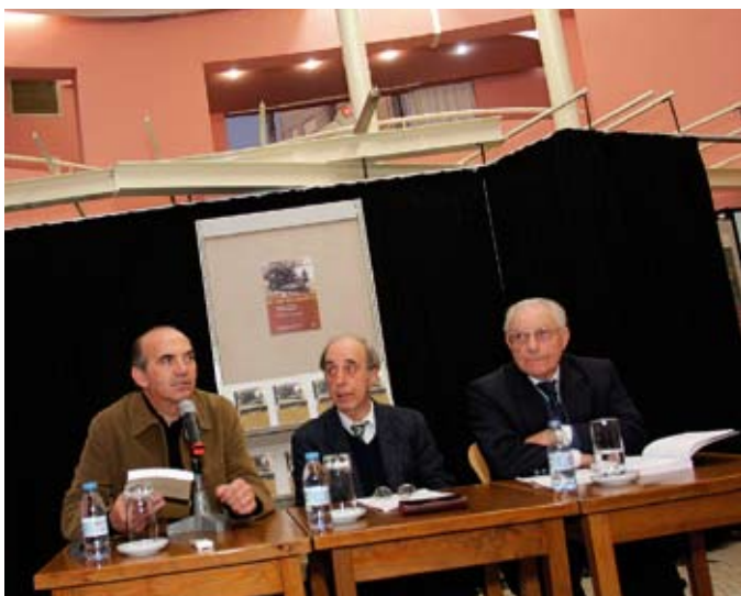
Apresentação do livro de Óscar Fangeiro