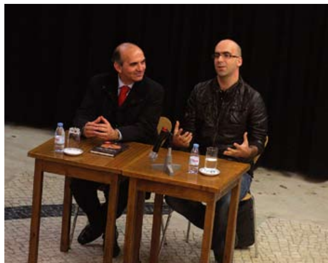
Apresentação do livro de valter hugo mãe

Estilos distintos, naturalidades diversas e gerações diferentes convergiram no universo literário dos escritores que nos últimos meses marcaram presença na Póvoa de Varzim.