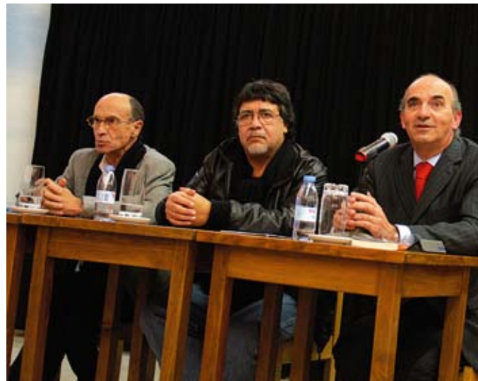
Apresentação do livro de Luis Sepúlveda